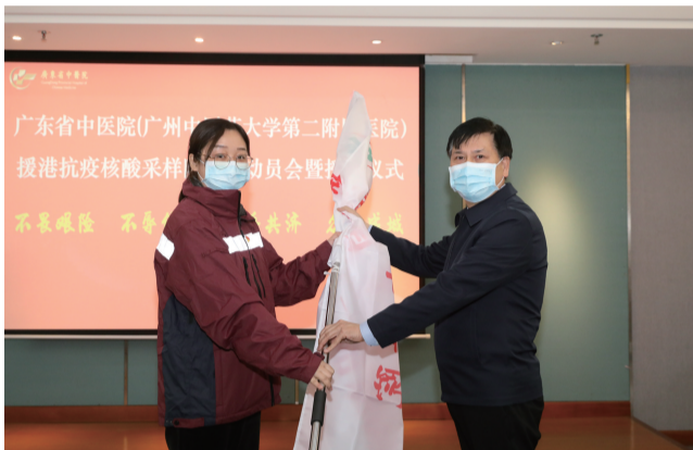
医院信息 2月19日,作为第二批内地援港抗疫医疗防疫工作队成员,我院派出21名队员赴港,主要负责核酸采样工作。此次派出的21名队员中,有参加过支援湖北武汉抗疫,有

参加过支援广州、东莞、深圳、珠海等地的核酸采样工作医护人员,他们都具有丰富的实践经验,对圆满完成工作任务充满信心。