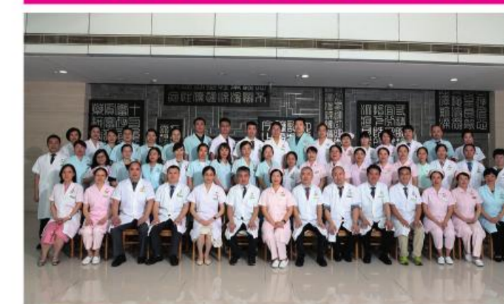
★大德路总院机关第二党总支

推动“堡垒+服务”建设,坚持“党建+业务”导向,建设“先进+先锋”队伍,发挥专科优势开展对口帮扶,促进优质医疗资源下沉,联合多个党总支开展“我为群众办实事”活动,推动中医药健康科普、中医特色疗法、中医养生功法走进养老院。