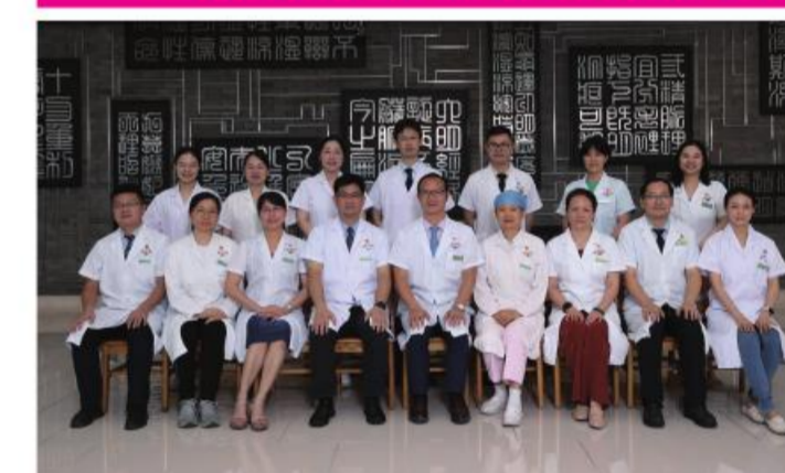
★大德路总院皮肤科党支部

牢固树立“四个意识”,坚定“四个自信”,坚决做到“两个维护”,强化政治判断力、领悟力、执行力。学思践悟、学通弄懂、学以致用,真正用党的先进思想武装头脑、指导实践、推动工作。