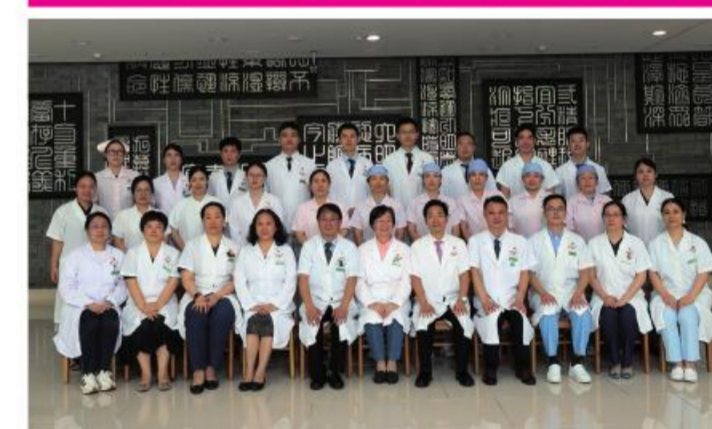
★大德路总院内科第三党支部

党支部学习贯彻党的二十大精神,贯彻落实医院党委关于党的基层组织建设三年行动计划,运用党的建设理论,提高党务工作水平,履行党的建设工作职责。肾内科2020-2022连续获得“医疗质量杯”,透析科2022获得“服务质量杯”。