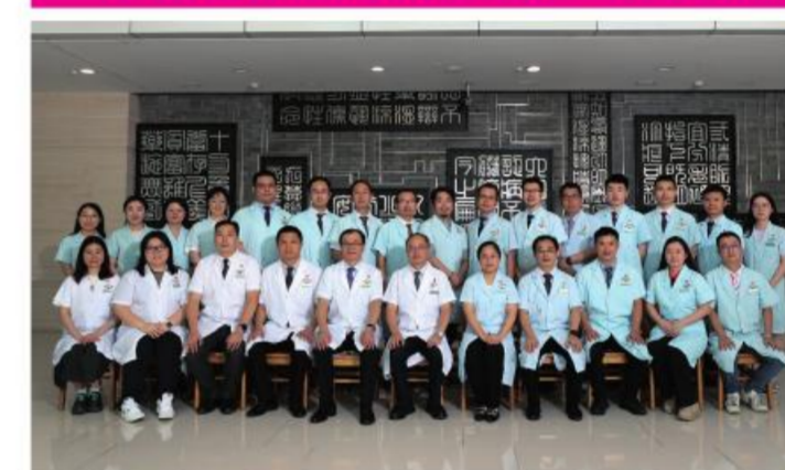
★大德路总院机关第二党支部

保持高政治站位,打造学习型党支部,坚持“围绕中心、服务发展”要求,创建“服务临床一线,强化职能担当”党建品牌,为助推医院高质量发展汇聚英才、信息赋能,维护风清气正医院生态保驾护航。2022年获校第四批党建工作样板支部创建单位。