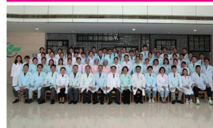
★大德路总院医技党总支

总支将“第一议题”制度化,把学习融入日常,抓在经常。持续提升服务能力,紧密服务群众,CT实现所有院区零预约的飞跃性进步,MR预约时间亦大幅度缩短,影像医学部各院区均实现24小时之内取报告。