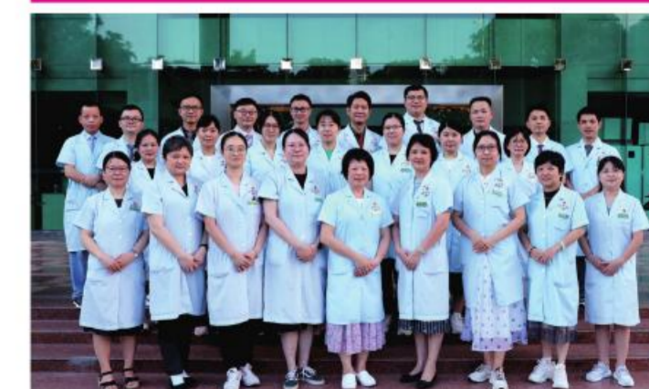
★二沙岛医院药剂党支部

党支部将党建工作与学科建设、药学服务、人才培养、价值引领、科室文化建设、疫情防控等工作有机结合,被医院提名服务质量杯候选科室,抗疫期间获“服务窗口之星”,打造精益科室,推广中医药文化,团结带领党员、群众出色完成各项任务。