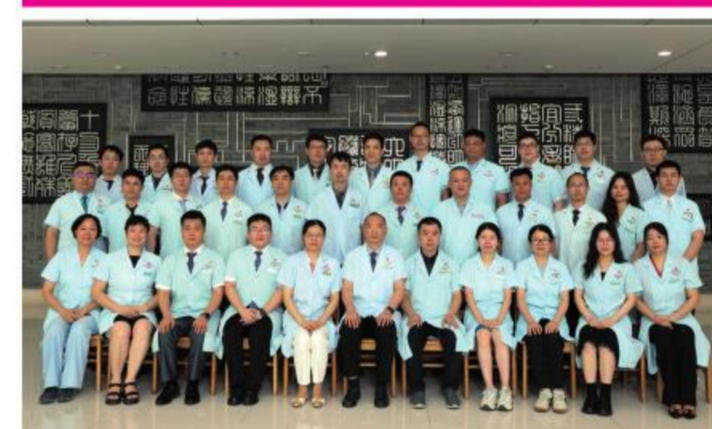
★大德路总院后勤党支部

党支部发挥基层党建引领,打造涵养党性教育,注重党员队伍培养,不断锤炼党员的战斗力,勇于担当的政治锐气。在日常后勤保障、抗击疫情、应对突发事件中涌现出许多先进个人和集体。筑牢后勤人员廉政根基,后勤服务党员品牌更亮。