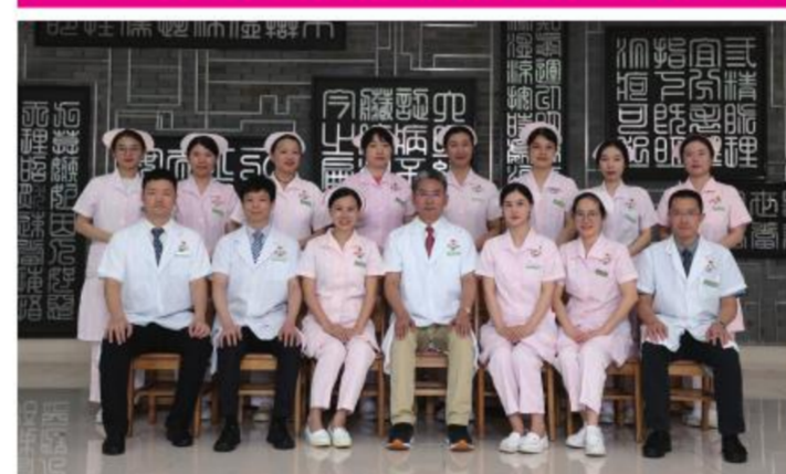
★大德路总院脑病科第一党支部

推进支部标准化,建立“带学、讲学、考学”学习制度,凝聚先锋作用,加强人才培养,打造优质服务。内强素质,外强协作,不断增强组织建设能力。2022年脑血管病中心被授予“全国工人先锋号”称号。