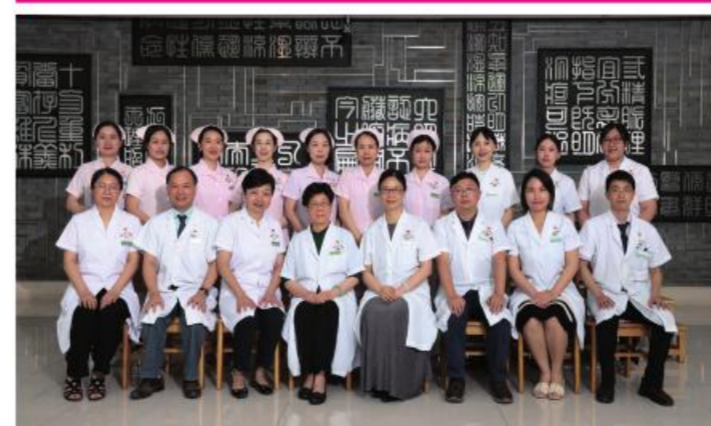
★大德路总院乳腺科党支部

坚持党建促发展党建工作理念,清正廉洁是党员干部安身立命之本,全体党员始终贯彻“病人至上”医院核心价值观,为医院新时代高质量发展提供坚强保障。“粉红丝带”“三八妇女节”举办健康教育,深受广大女性同胞欢迎。