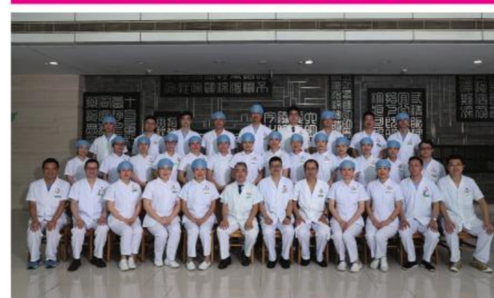
★大德路总院急诊党总支

积极开展支部主题党日活动,积极推动总支党建工作。连续多年完成了各项责任目标,无医疗事故和差错,无重大投诉。急救技能培训团队还走入社区、学校、地铁、公安系统,组织开展急救技能培训系列活动。