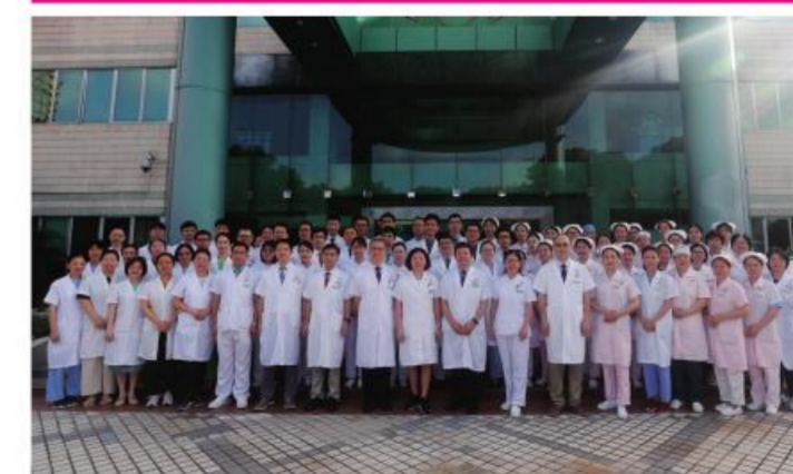
★二沙岛医院第一党总支

紧紧围绕医院中心工作,落实上级党组织工作部署,贯彻落实医院党委关于党的基层组织建设三年行动计划,组织各支部发挥基层党组织和党员作用,推动落实全面从严治党工作,坚持中西医并重,进一步扩大专科临床服务能力及专科影响力。