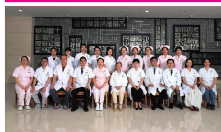
★大德路总院儿科党支部

以习近平新时代中国特色社会主义思想为指导,继承和发扬党的优良传统和作风,以医院医疗服务为中心,从实际出发,在医疗技术上硕果累累,充分发挥基层党组织战斗堡垒作用。在国家级学术影响力中医儿科学上排名第十。