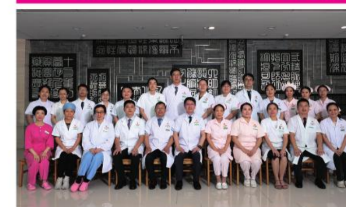
★大德路总院内科第一党支部

党支部紧紧围绕以习近平新时代中国特色社会主义思想为指导,不断提高职工的政治素质和思想水平,开展党建工作;在技术、服务和科研上均取得了较大的进步,获得各项荣誉,为建设广东省高水平医院贡献自己的力量。