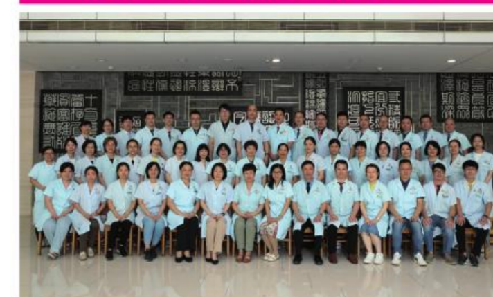
★大德路总院药剂党总支

党总支组织多样化、时代化的学习,并举办特色党建活动,开展“中医药文化进校园”志愿服务和科普活动。党建引领业务,获得“紫荆特色炮制技术规范发掘”立项,通过全国中药炮制技术传承基地验收并获得国家2023年的滚动资助。