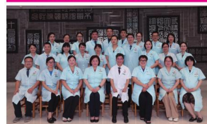
★大德路总院机关第一党支部

党支部示范建成领导班子强,党员先锋模范作用强,工作机制保障强,服务中心效率高,示范引领群众强的新时代党建工作样板支部。2022年通过广州中医药大学“党建工作样板支部”验收,2023年成为第四批广东省党建工作样板支部创建单位。