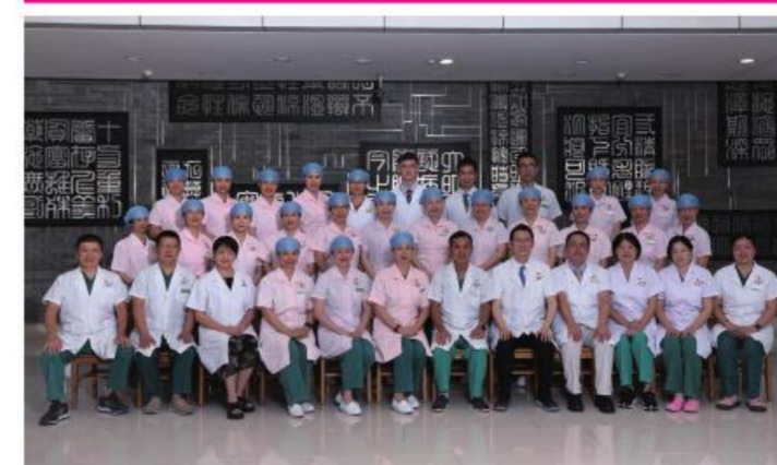
★大德路总院麻醉科党支部

始终将党建工作和业务工作深度融合,强化党建理论学习,提升政治素养和业务能力,提升服务水平,确保每日上百台手术安全开展,充分发挥党员先锋模范作用,增强党支部的凝聚力和向心力。曾获得“医疗质量杯”“最佳集体”奖。